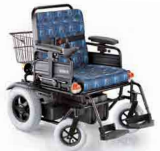
Con cestino With basket